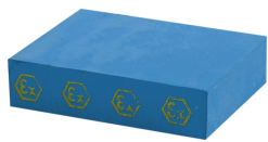
Plný kompenzační modul CM Ex