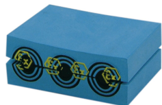
Modul CM Ex s technologií Multidiameter™